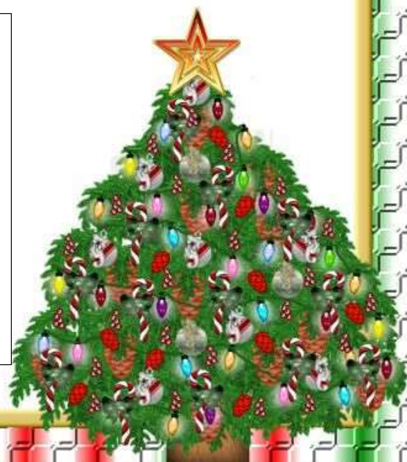
Figure smrečic postavite na začetek barvnih polj. Vsaka smrečica ima drugačne barve zvezdo na vrhu, zato jo postavite na ustrezno začetno polje. Npr. smrečica z rumeno zvezdo začne na rumenem polju. Prvi igralec vrže kocko. Ko vrže npr. rdečo barvo, takrat se prestavi za eno rdeče polje naprej smrečica z rdečo zvezdo. Če vržete belo polje na kocki, jo ponovno vržete. Tako se skupaj igrate in premikajte po poljih naprej vse do zadnjega polja, kjer je smrečica z okraski. Skupaj ugotovite, kateri barvi smrečice bo prvi uspelo »pridet« do okraskov.